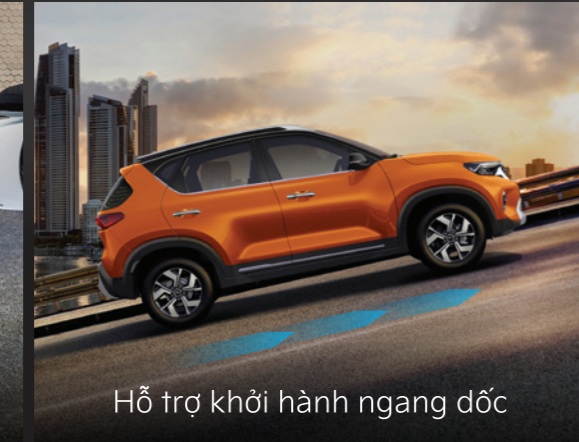
Hỗ trợ khởi hành ngang dốc