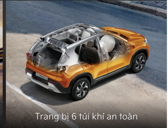
Trang bị 6 túi khí an toàn