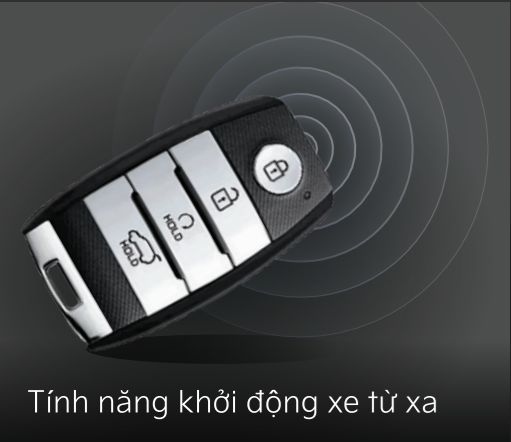
Tính năng khởi động xe từ xa

Kia Seltos & Kia Sonet trang bị các tính năng điều khiển thông minh mang lại sự tự tin cho người lái và đảm bảo an toàn tối ưu trong mọi điều kiện vận hành