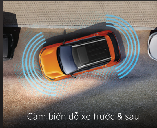
Cảm biến đỗ xe trước & sau