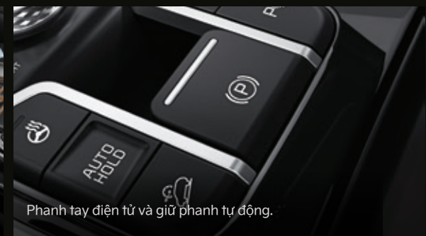
Phanh tay điện tử và giữ phanh tự động.