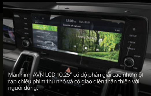
Màn hình AVN LCD 10.25" có độ phân giải cao như một rạp chiếu phim thu nhỏ và có giao diện thân thiện với người dùng.