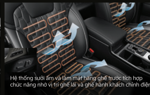
Hệ thống sưởi ấm và làm mát hàng ghế trước tích hợp chức năng nhớ vị trí ghế lái và ghế hành khách chính điện