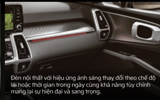
Đèn nội thất với hiệu ứng ánh sáng thay đổi theo chế độ lái hoặc thời gian trong ngày cùng khả năng tùy chỉnh mang lại sự hiện đại và sang trọng.