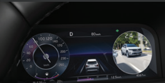
HIỂN THỊ ĐIỂM MÙ TRÊN MÀN HÌNH ĐA THÔNG TIN (Blind-spot View Monitor - BVM) Cung cấp cho người lái hình ảnh video lên màn hình đa thông tin.

Kia Sorento được trang bị hệ thống an toàn chủ động thông minh vượt trội, mang lại sự an tâm và tin tưởng cho người dùng