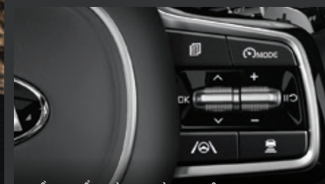
ĐIỀU KHIỂN HÀNH TRÌNH THÔNG MINH (Smart Cruise Control - SCC) Hệ thống tính toán vị trí tương đối so với phương tiện phía trước để đảm bảo cự ly an toàn giữa 2 xe khi lưu thông trên đường.