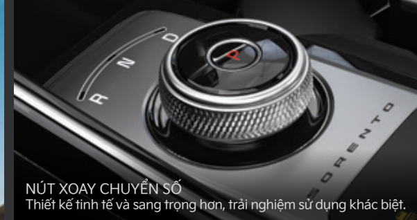
NÚT XOAY CHUYỂN SỐ Thiết kế tinh tế và sang trọng hơn, trải nghiệm sử dụng khác biệt.