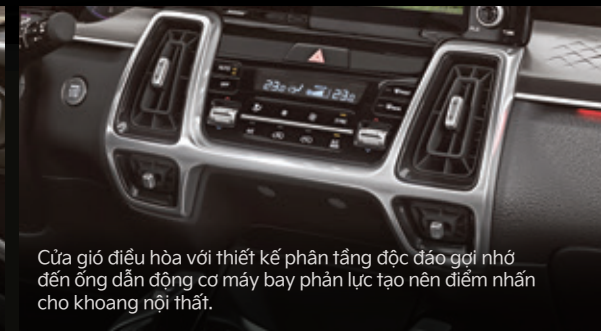
Cửa gió điều hòa với thiết kế phân tầng độc đáo gợi nhớ đến ống dẫn động cơ máy bay phản lực tạo nên điểm nhấn cho khoang nội thất.