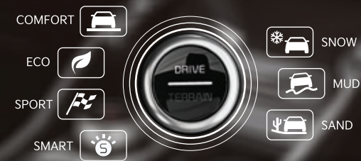
Trang bị 4 chế độ lái & 3 chế độ địa hình, Kia Sorento mạnh mẽ và linh hoạt trên mọi cung đường.