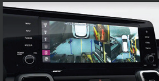
HỆ THỐNG QUAN SÁT TOÀN CẢNH (Surround View Monitor - SVM) Hệ thống camera quan sát xung quanh có độ phân giải cao hiển thị hình ảnh rõ nét và liền mạch.