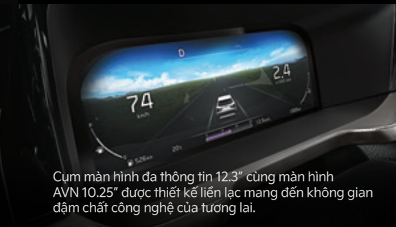
Cụm màn hình đa thông tin 12.3" cùng màn hình AVN 10.25" được thiết kế liền lạc mang đến không gian đậm chất công nghệ của tương lai.

Nội thất Kia Sorento được thiết kế rộng rãi, tinh tế, sang trọng và hiện đại với nhiều trang bị tiện ích cao cấp