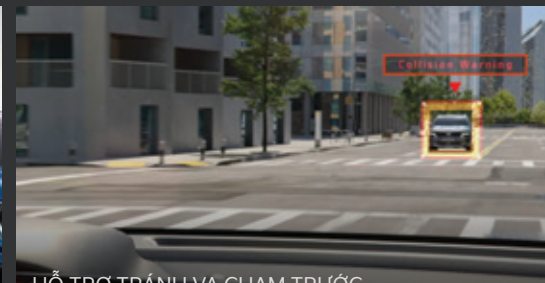
HỖ TRỢ TRÁNH VÀ CHẠM TRƯỚC (Forward Collision-Avoidance Assist - FCA) Hệ thống đánh giá nguy cơ và chạm giữa xe với vật thể phía trước và đưa ra cảnh báo cho người lái, đồng thời hỗ trợ phanh khẩn cấp trong tình huống nguy hiểm.