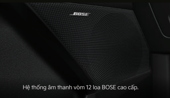
Hệ thống âm thanh vòm 12 loa BOSE cao cấp.