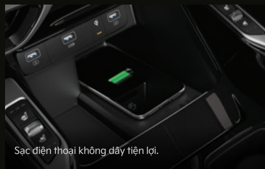
Sạc điện thoại không dây tiện lợi.