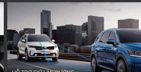
HỖ TRỢ GIỮ LÀN ĐƯỜNG (Lane Following Assist - LFA) Hệ thống hỗ trợ giữ làn đường có thể nhận ra các vạch kẻ đường và hỗ trợ đánh lái để giữ xe luôn đi ở trung tâm làn đường.