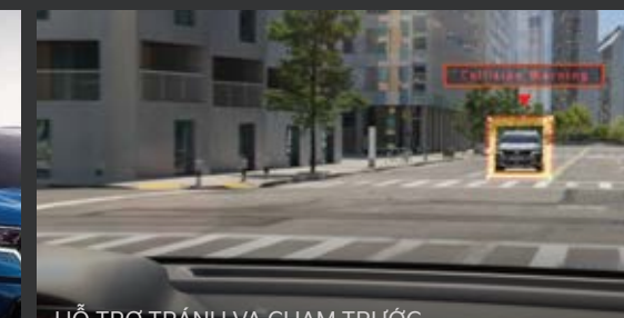
HỖ TRỢ TRÁNH VÀ CHẠM TRƯỚC (Forward Collision-Avoidance Assist - FCA) Hệ thống đánh giá nguy cơ và chạm giữa xe với vật thể phía trước và đưa ra cảnh báo cho người lái, đồng thời hỗ trợ phanh khẩn cấp trong tình huống nguy hiểm.