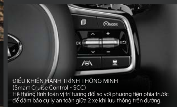
ĐIỀU KHIỂN HÀNH TRÌNH THÔNG MINH (Smart Cruise Control - SCC) Hệ thống tính toán vị trí tương đối so với phương tiện phía trước để đảm bảo cự ly an toàn giữa 2 xe khi lưu thông trên đường.