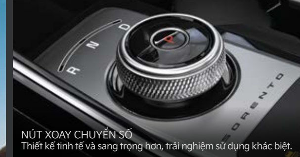
NÚT XOAY CHUYỂN SỐ Thiết kế tinh tế và sang trọng hơn, trải nghiệm sử dụng khác biệt.