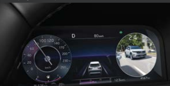
HIỂN THỊ ĐIỂM MÙ TRÊN MÀN HÌNH ĐA THÔNG TIN (Blind-spot View Monitor - BVM) Cung cấp cho người lái hình ảnh video lên màn hình đa thông tin.

Kia Sorento được trang bị hệ thống an toàn chủ động thông minh vượt trội, mang lại sự an tâm và tin tưởng cho người dùng