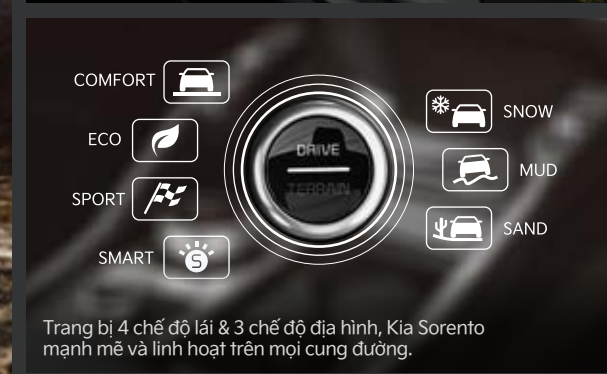
Trang bị 4 chế độ lái & 3 chế độ địa hình, Kia Sorento mạnh mẽ và linh hoạt trên mọi cung đường.