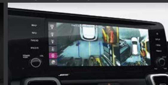
HỆ THỐNG QUAN SÁT TOÀN CẢNH (Surround View Monitor - SVM) Hệ thống camera quan sát xung quanh có độ phân giải cao hiển thị hình ảnh rõ nét và liền mạch.