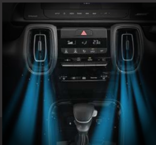
Hệ thống điều hòa tự động