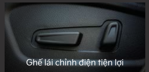
Ghế lái chỉnh điện tiện lợi