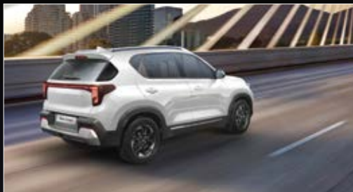
Điều khiển hành trình & hỗ trợ giới hạn tốc độ

Trang bị tính năng an toàn thông minh mang lại sự tự tin cho người lái và đảm bảo an toàn tối ưu cho mọi điều kiện vận hành.