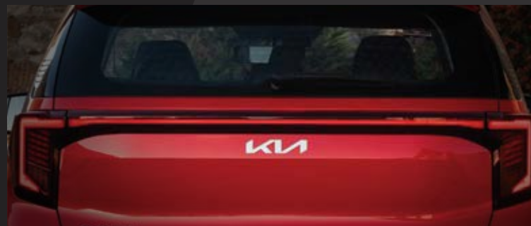
Dải đèn LED nổi liền mở rộng theo phương ngang bề thế