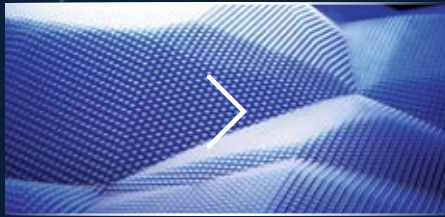
SỨC MẠNH TẠO SỰ ĐỔI MỚI

Vận dụng những mặt đối lập tạo nên thiết kế tổng thể hoàn hảo, mang đến nguồn cảm hứng sáng tạo và sự khác biệt của thương hiệu Kia.