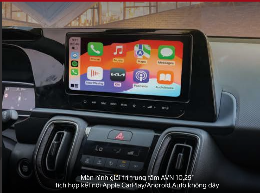
Màn hình giải trí trung tâm AVN 10,25" tích hợp kết nối Apple CarPlay/Android Auto không dây

Khoang nội thất với thiết kế hiện đại, các chất liệu cao cấp tạo không gian sang trọng, nhiều trang bị tiện ích hỗ trợ hành khách.