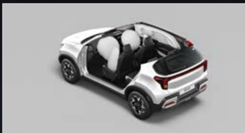
6 túi khí