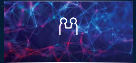
CÔNG NGHỆ VÌ CUỘC SỐNG