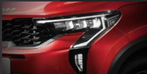
Đèn định vị LED thiết kế Star-map bắt mắt