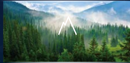
ĐẬM CHẤT TỰ NHIÊN