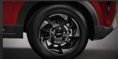
Mâm hợp kim 16 inch