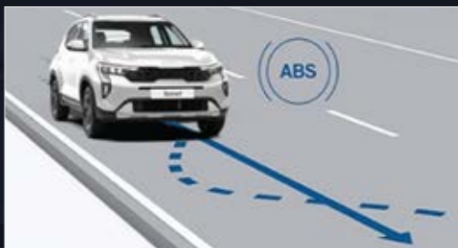
Hệ thống chống bó cứng phanh ABS