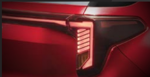
Cụm đèn sau thiết kế Star-map đồng nhất