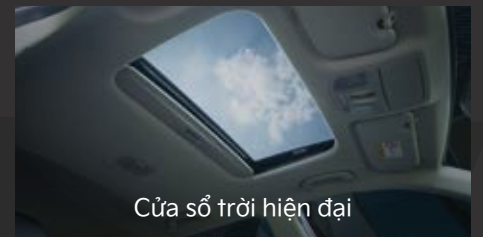
Cửa sổ trời hiện đại