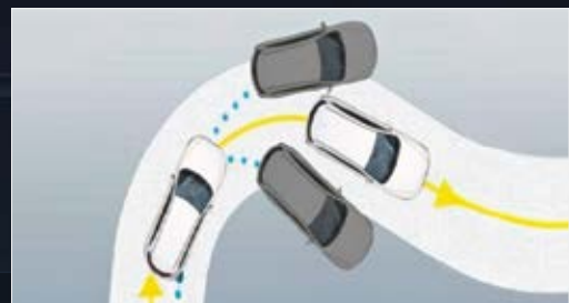
Hệ thống cân bằng điện tử ESC