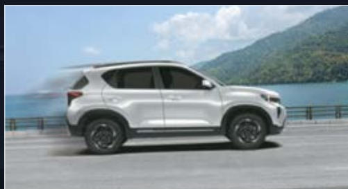
Hệ thống khởi hành ngang dốc HAC