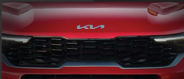
Lưới tản nhiệt mũi hổ thiết kế họa tiết hình sóng

Thiết kế mới thể thao đậm chất SUV với các hình khối góc cạnh, họa tiết tương phản tạo nên diện mạo bề thế, mạnh mẽ thể hiện phong cách cá tính và năng động.