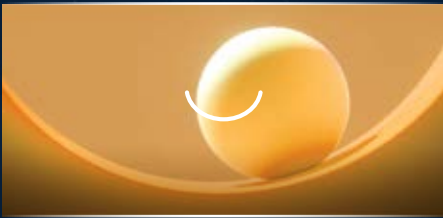
MANG ĐẾN HỨNG KHỞI VÀ NIỀM VUI