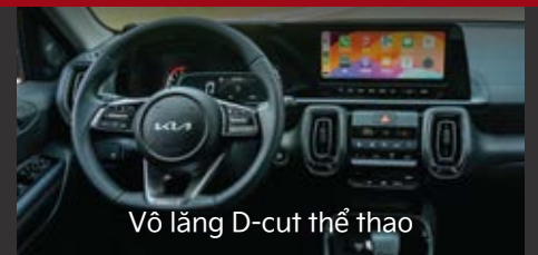
Vô lăng D-cut thể thao