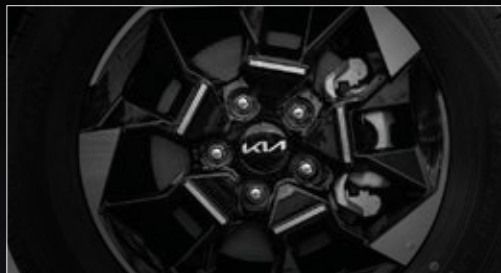
Hệ thống phanh đĩa trước và sau