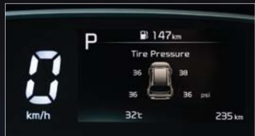
Cảm biến áp suất lốp