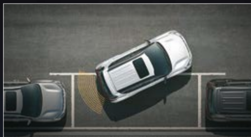
Cảm biến hỗ trợ đỗ xe phía sau