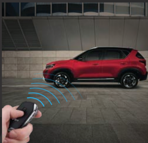
Chìa khóa thông minh + khởi động từ xa