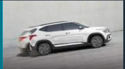
Hệ thống ABS, ESC, HAC