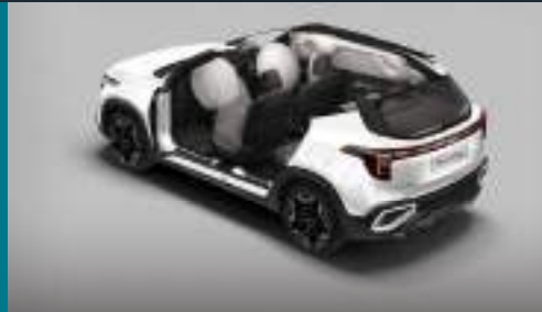
6 túi khí