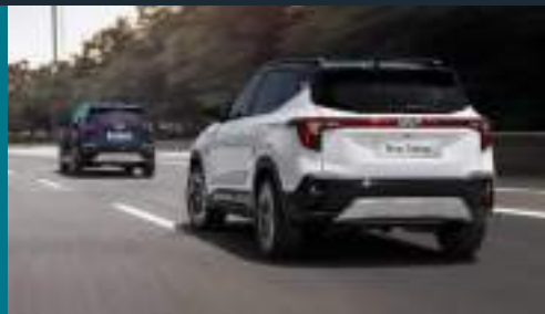
Cảnh báo và hỗ trợ theo làn Lane Following Assist (LFA)