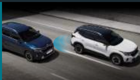
Hỗ trợ tránh và chạm điểm mù Blind-Spot Collision-avoidance Assist (BCA)