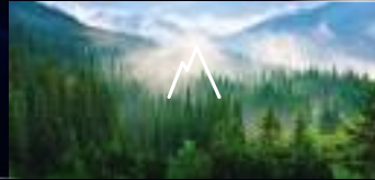
ĐẬM CHẤT TỰ NHIÊN