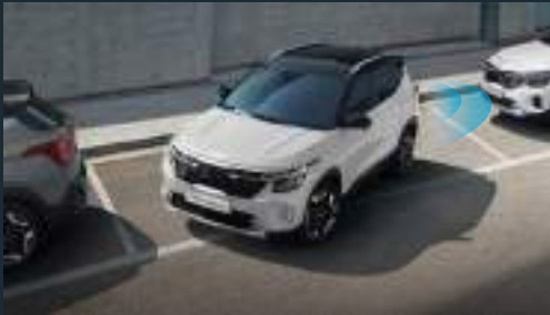
Camera lùi & Cảm biến hỗ trợ đỗ xe phía sau

Trang bị đầy đủ các tính năng an toàn cao cấp ADAS hỗ trợ người lái, mang lại cảm giác an tâm cho hành khách trong mọi điều kiện vận hành.