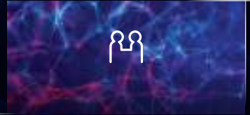
CÔNG NGHỆ VÌ CUỘC SỐNG

Hệ thống đèn lấy cảm hứng từ hình tượng các chòm sao (Star-map) mang đến hình ảnh cuốn hút và đặc trưng cho New Seltos.