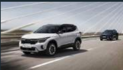
Điều khiển hành trình thích ứng Smart Cruise Control with Stop & Go (SCC)