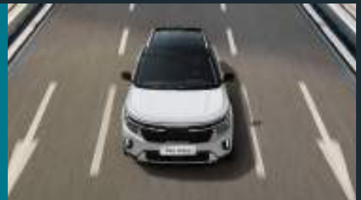
Cảnh báo và hỗ trợ giữ làn Lane Keeping Assist (LKA)