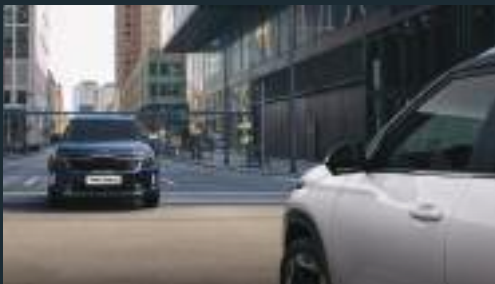
Hỗ trợ tránh và chạm phía trước Forward Collision-avoidance Assist (FCA)