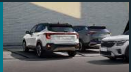
Hỗ trợ tránh và chạm phương tiện cắt ngang khi lùi Rear Cross-Traffic Collision-Avoidance Assist (RCCA)