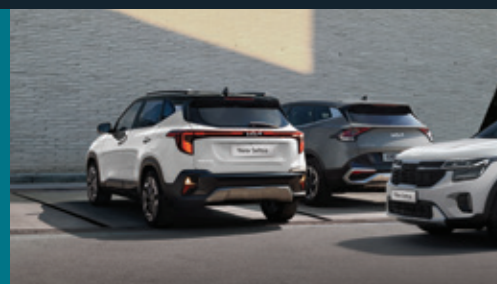
Hỗ trợ tránh va chạm phương tiện cắt ngang khi lùi Rear Cross-Traffic Collision-Avoidance Assist (RCCA)