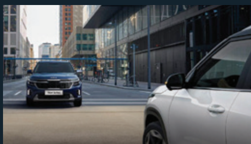
Hỗ trợ tránh va chạm phía trước Forward Collision-avoidance Assist (FCA)