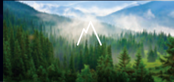
ĐẬM CHẤT TỰ NHIÊN