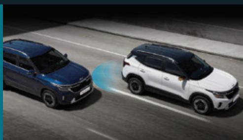
Hỗ trợ tránh va chạm điểm mù Blind-Spot Collision-avoidance Assist (BCA)