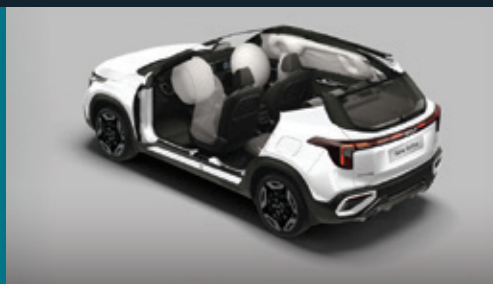
6 túi khí