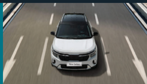
Cảnh báo và hỗ trợ giữ làn Lane Keeping Assist (LKA)