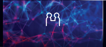
CÔNG NGHỆ VÌ CUỘC SỐNG

Hệ thống đèn lấy cảm hứng từ hình tượng các chòm sao (Star-map) mang đến hình ảnh cuốn hút và đặc trưng cho New Seltos.