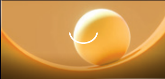
MANG ĐẾN HỨNG KHỞI VÀ NIỀM VUI

Ứng dụng thành tố "Power to progress" - Sức mạnh tạo sự đổi mới" phát triển thiết kế theo xu hướng tương lai.