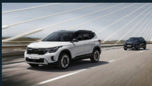
Điều khiển hành trình thích ứng Smart Cruise Control with Stop & Go (SCC)