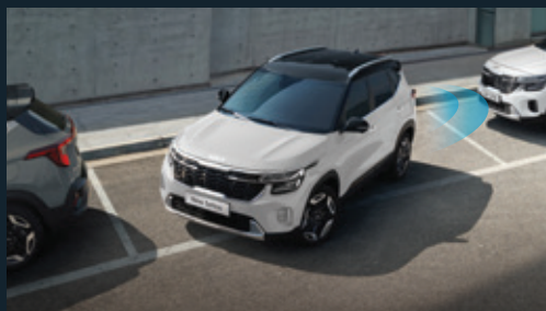
Camera lùi & Cảm biến hỗ trợ đỗ xe phía sau

Trang bị đầy đủ các tính năng an toàn cao cấp ADAS hỗ trợ người lái, mang lại cảm giác an tâm cho hành khách trong mọi điều kiện vận hành.