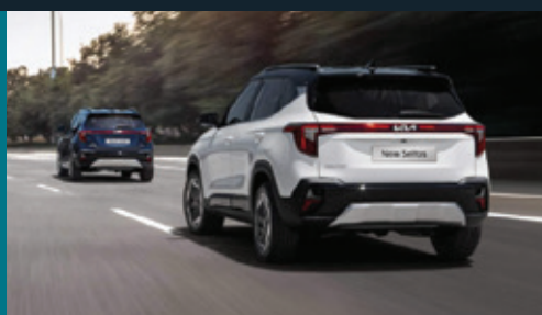
Cảnh báo và hỗ trợ theo làn Lane Following Assist (LFA)