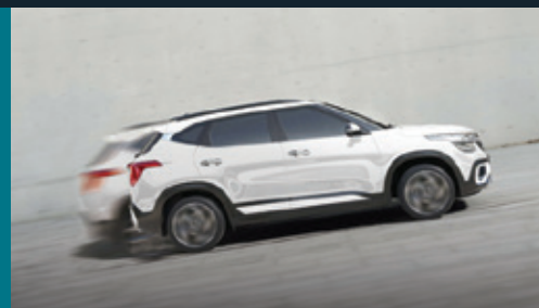
Hệ thống ABS, ESC, HAC